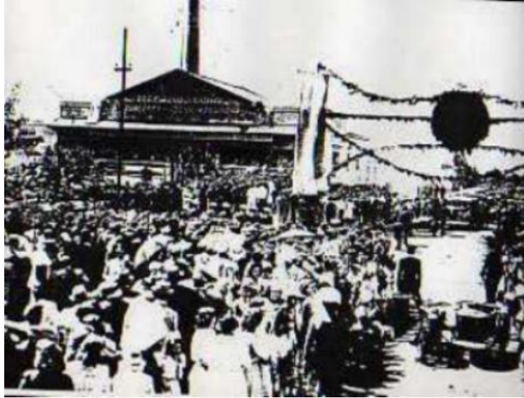
Imagen del público que asistió a la inauguración de la fábrica de Roldán

Hacia mediados de los años '40, la Cooperativa abastecía el 98% del consumo lácteo de la ciudad de Rosario, evitándole a la misma la escasez o la mala calidad del producto.