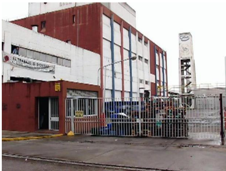
Planta Industrial de Cotar ubicada en calle Humberto Primo 1255 Rosario

Entre los años 1935 y 1945 el pueblo de Roldán evidencia un progreso notable en su urbanización debido al asentamiento de pobladores en su ejido urbano organizando nuevos barrios y zonas pobladas más allá de los antiguos arrabales. De igual manera, para estos años, el campo argentino conoce el proceso de paulatino despoblamiento. La política de sustitución de importaciones iniciada por el peronismo incentivó la mediana industria manufacturera, y el crecimiento del cordón industrial aledaño a Rosario y atrajo a cientos de jóvenes trabajadores. Era trabajo seguro, con leyes de amparo social y sin los riesgos de las tareas agrícolas. El Estatuto del Peón de Campo poco hizo para arraigar la población al campo. A pesar de esta realidad la actividad tambera en Roldán subsistirá con gran dinamismo. Las estancias debían recurrir a mano de obra de colonos que prefirieron el trabajo rural y a los provenientes de provincias vecinas.